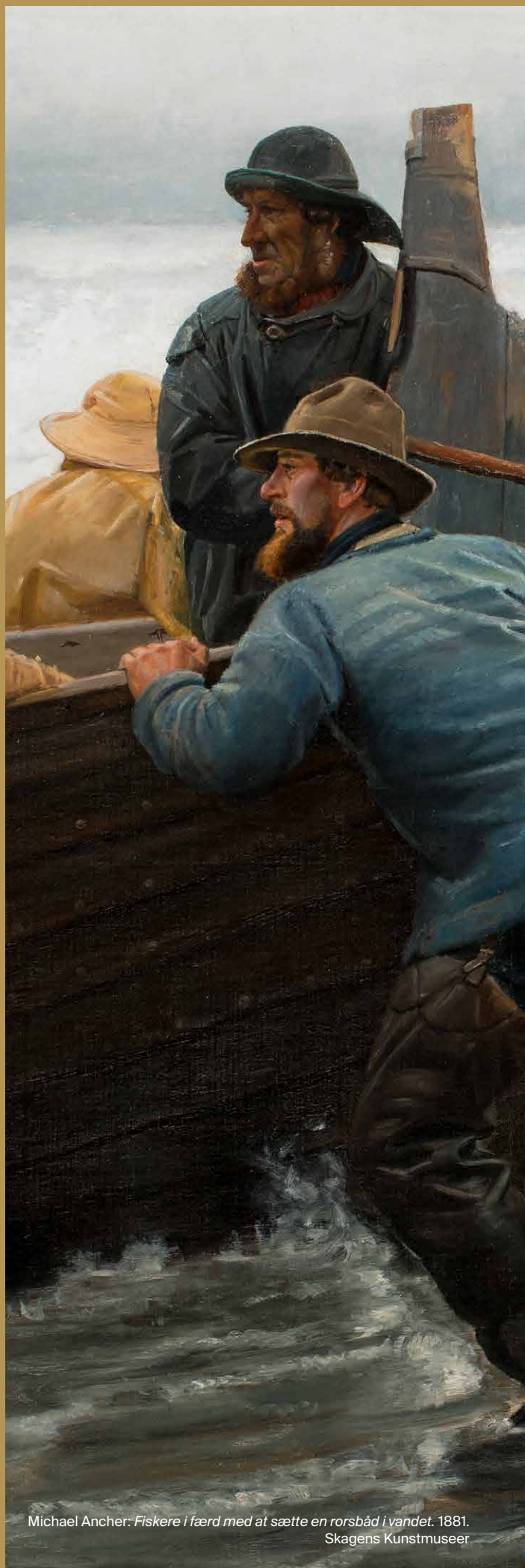
Michael Ancher: Fiskere i færd med at sætte en rorsbåd i vandet . 1881. Skagens Kunstmuseer

Der bliver rig mulighed for at sætte sit præg på den fremtidige formidlingsstrategi, hvor nøgleord som forståelse, aktualitet, relevans, samskabelse, brugerrejse og nytænkning bliver centrale. Så vi kigger efter en profil med en visionær og innovativ tilgang til at tænke formidling på tværs af organisatoriske fagområder.