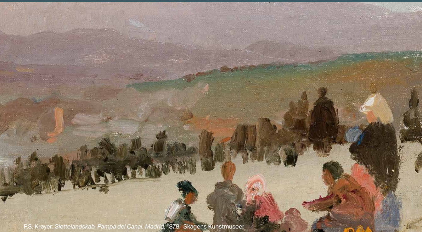
P.S. Krøyer: Slettekulturlandskab, Pampa del Canal, Madrid, 1878. Skagens Kunstmuseer

Afdelingen er ansvarlig for udvikling og drift af museets formidlingsstrategi og -program, som foruden publikumsformidling og -omvisning omfatter arbejdet med undervisningsprogrammer, kreative værksteder, samt arbejdet med at skabe en læringsfyldt og stærk brugeroplevelse og -rejse. Afdelingen spiller en central rolle via involvering i museets spændende projektportefølje – som indeholder både udstillings-, målgruppe-, oplevelses- og udviklingsprojekter.