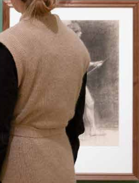
Informational text label for the drawing on the far right.