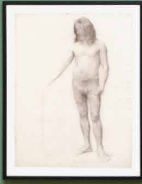
Informational text label for the drawing on the right.