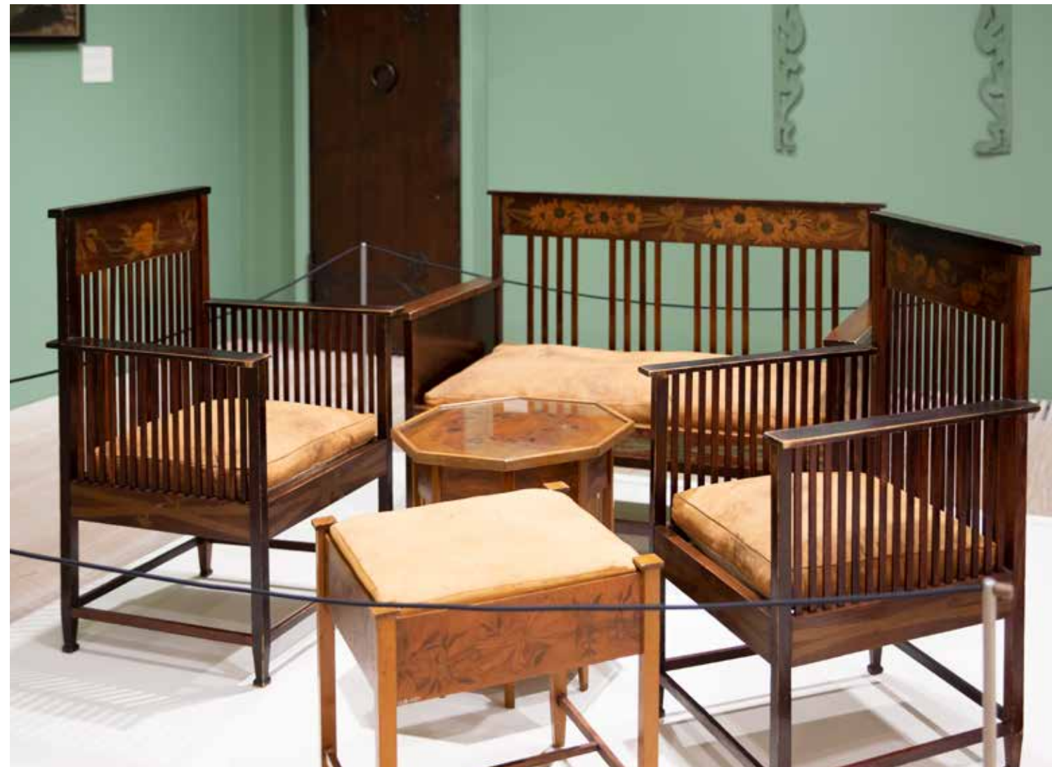
↑ Marie Krøyer-møblement der nu er en del af samlingen på Skagens Kunstmuseer.