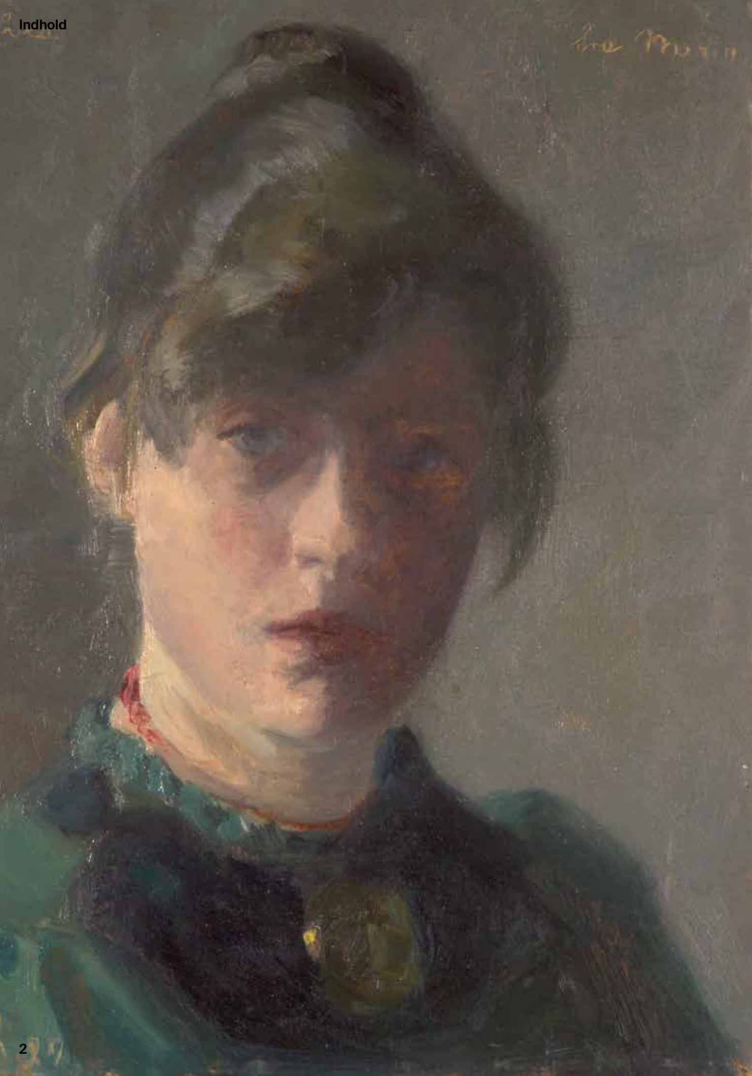
← Marie Krøyer: Selvportræt. 1889.