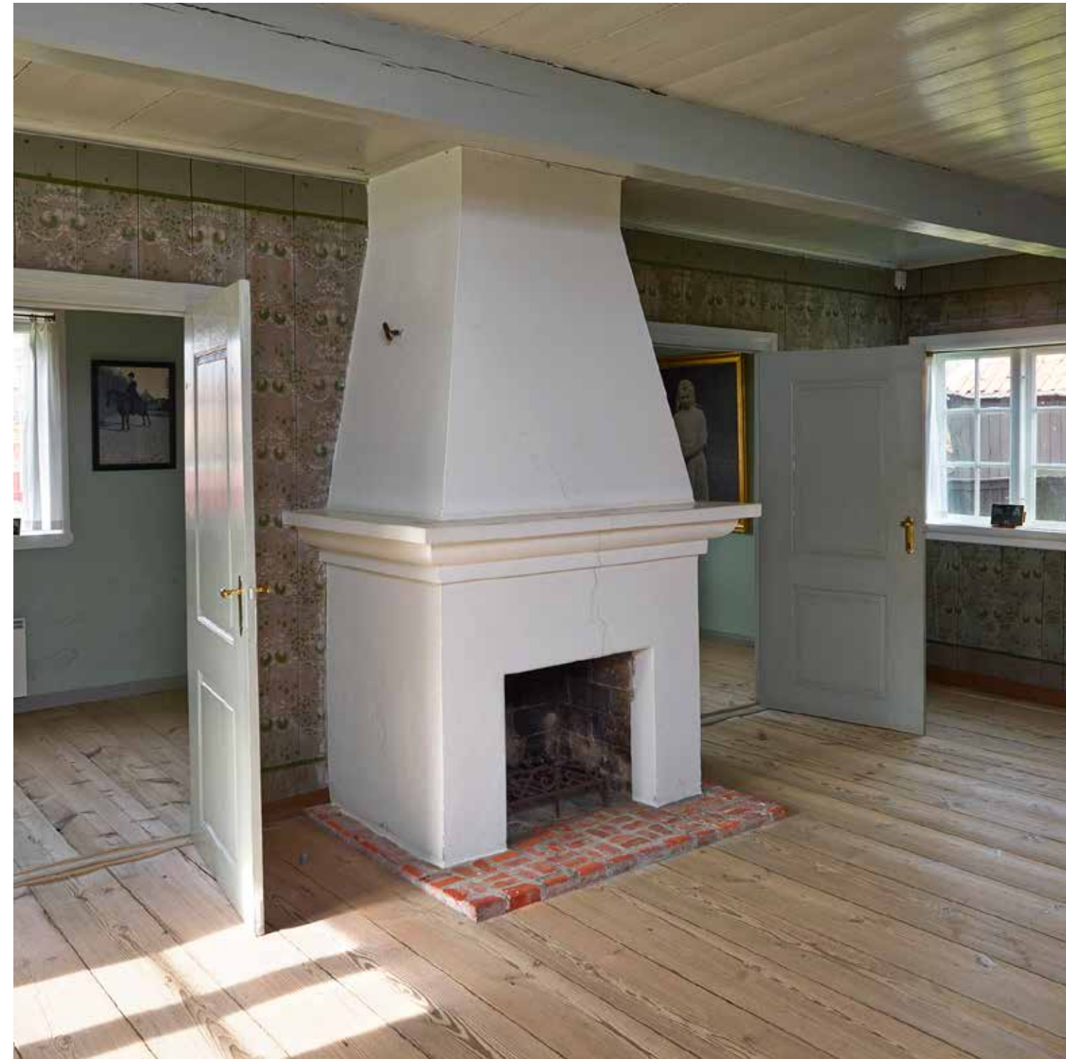
↑ Saxilds Gaard, der indrettes til forskningskontorer.