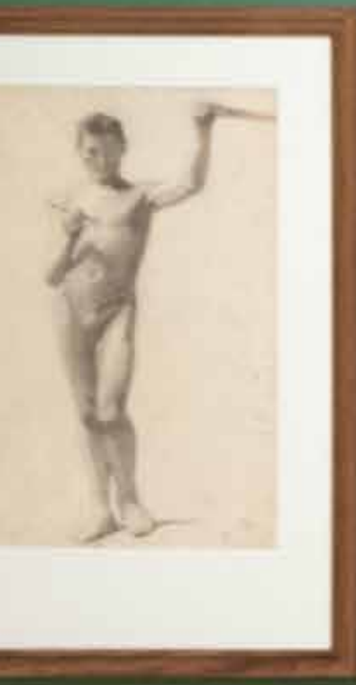
Informational text label for the drawing on the left.