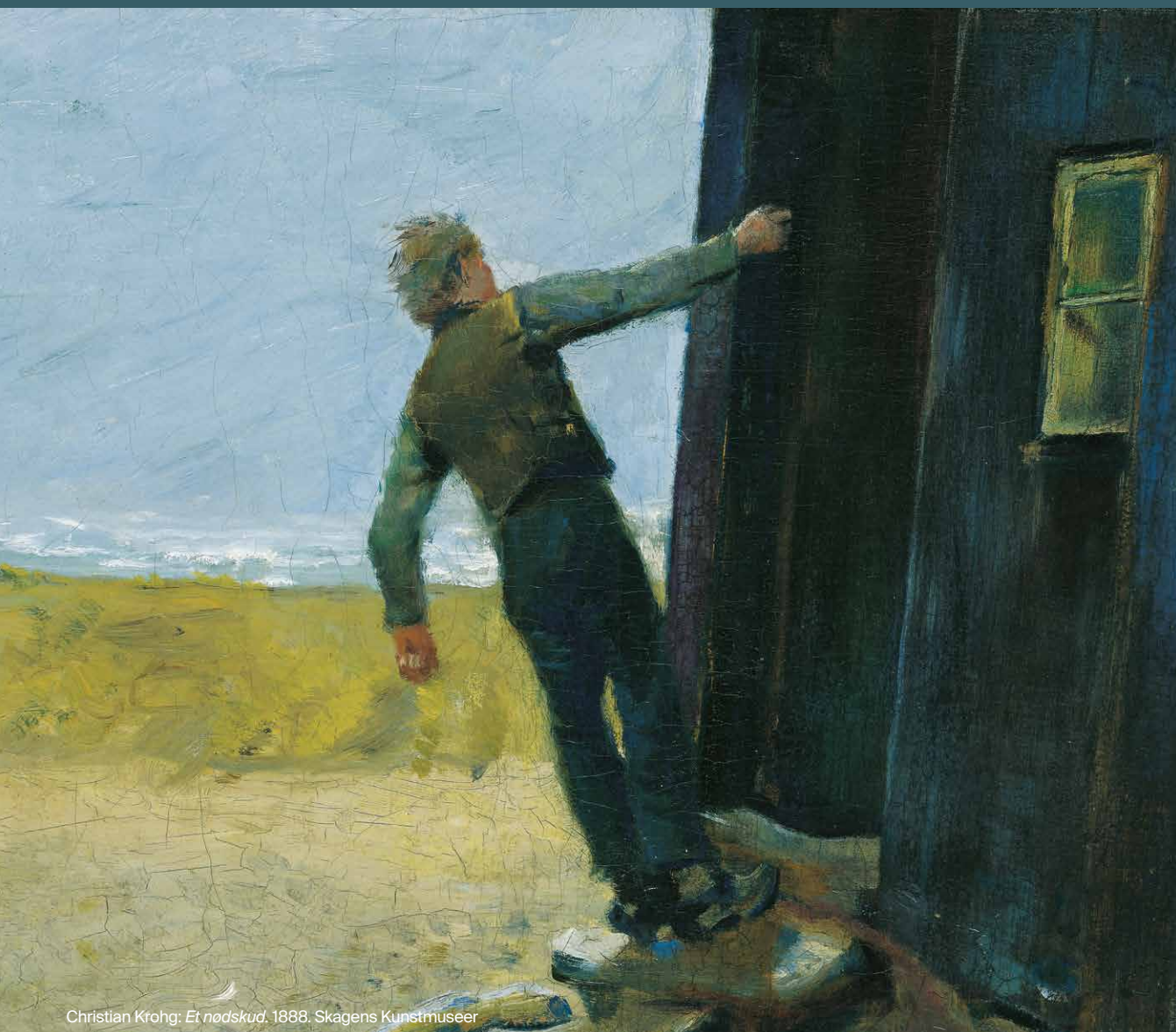
Christian Krohg: Et nødsud , 1888. Skagens Kunstmuseer

Vil du være med til at styrke sikkerheden på en af Danmarks smukkeste arbejdspladser?