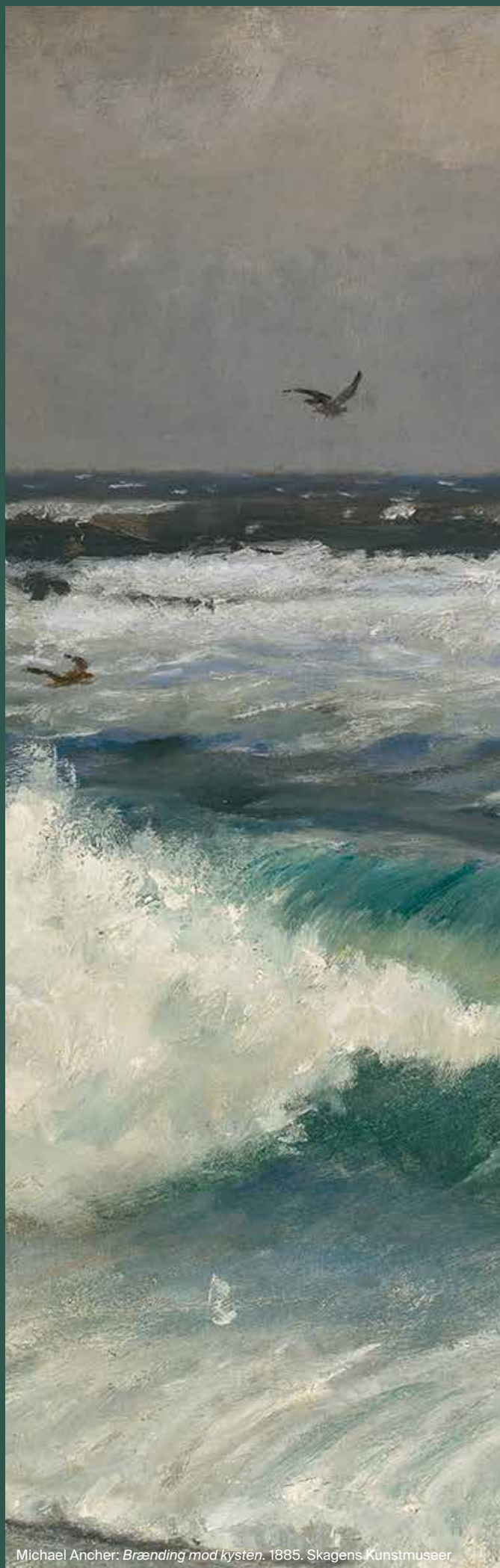
Michael Ancher: Brænding mod kysten . 1885. Skagens Kunstmuseer