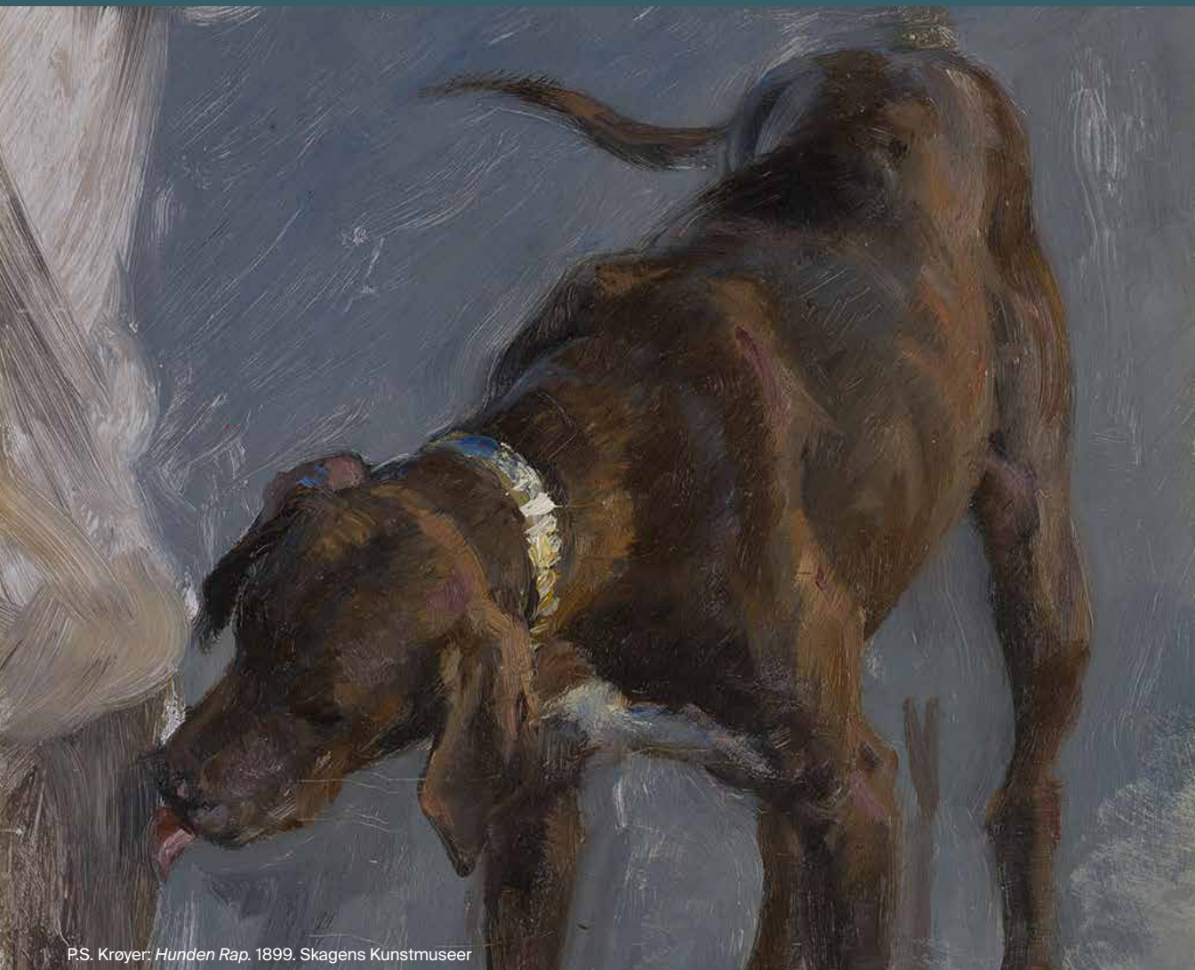
P.S. Krøyer: Hunden Rap . 1899. Skagens Kunstmuseer

Vi forventer at du kan tiltræde stillingen med opstart 1. oktober eller snarest muligt derefter.