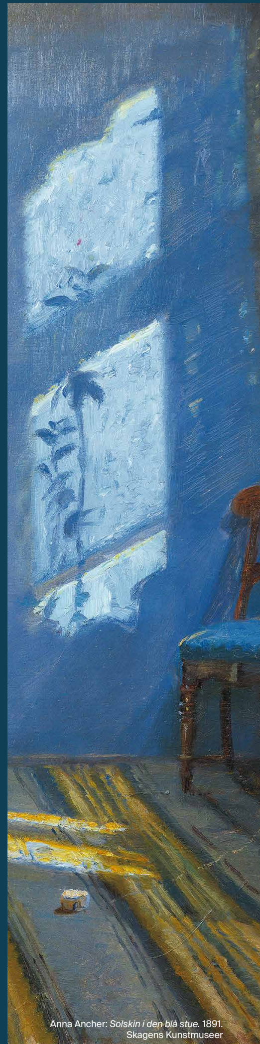
Anna Ancher: Solskin i den blå stue . 1891. Skagens Kunstmuseer

You be you. Vi er et hold af forskellige fagligheder og personligheder på Skagens Kunstmuseer; alt fra gartnere, kommunikationsmedarbejdere, administrative og projektledere til kunstfaglige, vagter og teknisk personale. Du er god til mennesker og synes, at der er værdi i alle museets afdelinger, samt at alle gerne vil bidrage til fælles løsninger. Du trives med mål og en god proces mod disse fælles mål, og så ser du en konflikt som et indsatsområde frem for et uoverskueligt problem. Du deler gerne din mening, og så har du sikkert en rigtig god humor.